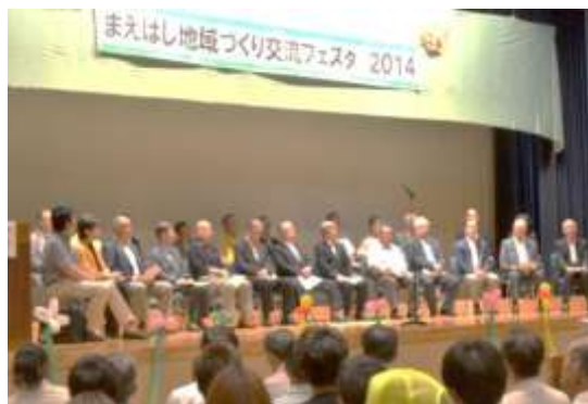
<オープニングセレモニーの様子>

6月22日(日)、「まえばし地域づくり交流フェスタ」が市内22の地域づくり協議会によって開催されました。 永明地区地域づくり協議会も活動状況のパネル展示のほか、午前のシンポジウムや午後のテーマ別分科会に委員が参加しました。 「あらためて考えよう『地域づくり』のこと」を基本テーマに行われた今回のフェスタでは、他地区の地域づくり協議会委員との討論や意見交換が熱心に行われ、参加者には大変有意義な研修となりました。