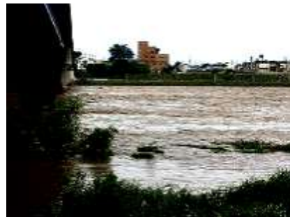
河川の氾濫の様子

地震・台風・ゲリラ豪雨など、災害はいつ起こるか分かりません。災害をなくすことはできませんが、災害への備えをすることで、被害を低減したり、回避したりすることができます。 この講座は、「日頃の備え」から、家庭の防災力を高めるポイントを紹介します。 講座名 防災講座 日時 ①6月5日(日)、②6月12日(日) 午前10時~11時20分(全2回) 会場 永明公民館 ホール 内容 ①「備えて安心！」