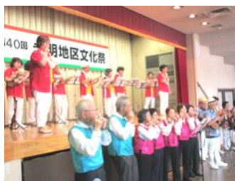
※写真は前回の開催風景