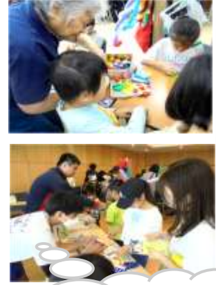
ボランティアで参加してくれた木瀬中学校の生徒と世代間交流も図れました。

11月3日(金)「のびゆく子ども」のびゆく広場」が各団体の協力により開催されました。当日は、予想していた来場者数を大幅に超え、200名近くの子もたちが足を運んでくれました。バルーンアートやわりばし鉄砲、誰でもできるスポーツのひとつであるポッチャ体験など10種類のコーナーが用意され、参加した子どもたちは普段体験できないことを味わうことができました。