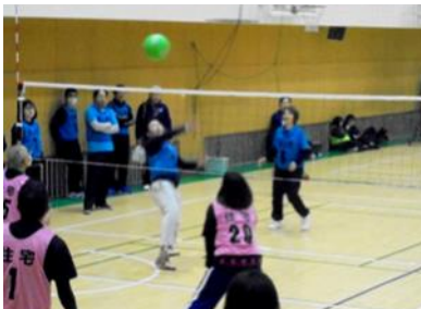
各ブロック入賞チーム