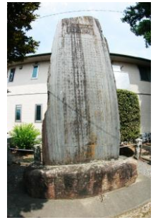
関口梨昌翁の石碑