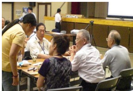
みんなで楽しく、地域づくり

永明公民館（TEL 027・266・5775・FAX 027・266・9312）まで なお、ファックスでご応募の方は本紙をファックス用紙として必要事項を記入のうえご利用してください。 みなさんのご応募をお待ちしております。