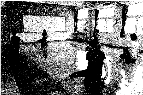
バランスボール (2020・9・16)

なお、例年児童館と共催で行っている夏祭り、クリスマス会はコロナウイルス拡大防止のため実施を中止とした。