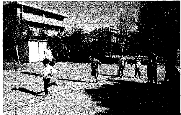
わんぱくキッズ・かけっこ教室