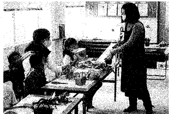
フラワーアレンジメント (2020・10・17)