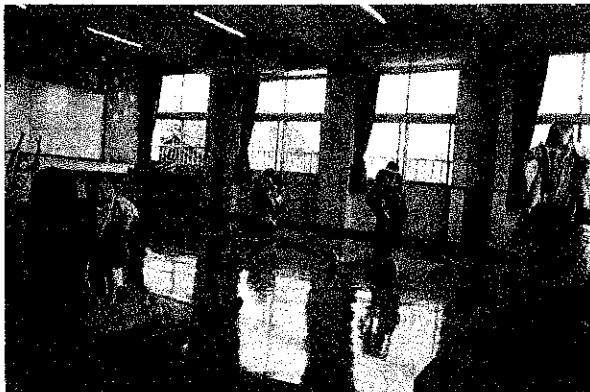
にこちゃんズ・抱っこでエクササイズ

土曜日は、幼児から小学生を対象に、スポーツ行事や制作行事等、集まる子どもたちの仲間作りを目指し「わんぱくキッズ」を実施した。