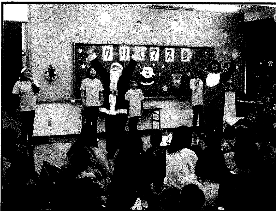
クリスマス会(2019・12・14)