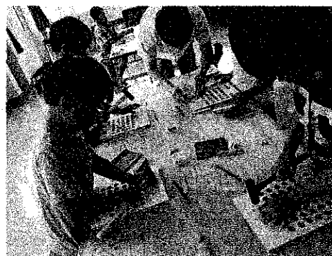
わんぱくキッズ・木工教室