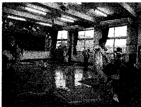
にこちゃんズ・ベビーヨガ

土曜日の午後は、4歳から小学生を対象に、思い出に残る行事の提供や、集まる子どもたちの仲間作りを目指し「わんぱくキッズ」を実施した。また、年間を通して、季節行事、伝統行事、スポーツ行事等も行った。