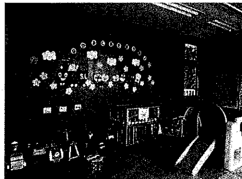
2階 視聴覚室兼乳幼児室