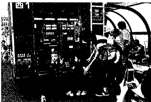
防火教室・避難訓練 (大好きな消防車の前で決めポーズ)

母親クラブの運営が円滑に進むよう支援を行った。夏祭り、防火教室、クリスマス会の3行事については共催し、交流を図った。