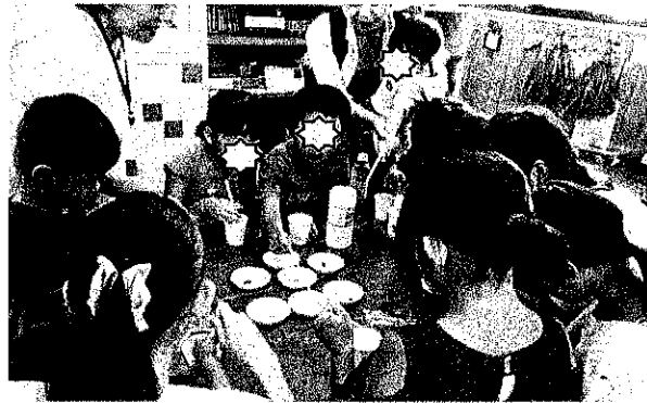
スライム作り（ホウ砂と洗濯のりを混ぜて、 絵の具で好きな色をつけました）