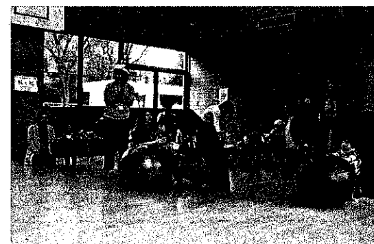
ミニ運動会 (はじめての大玉ころがしにドキドキわくわく)