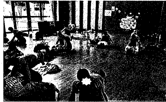
産後エクササイズ (かわいい赤ちゃんがいっぱい！)