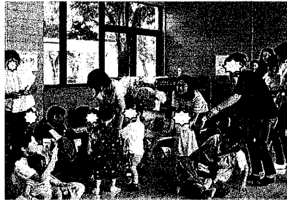
お祭りごっこ (ミニおみこしに大歓声)