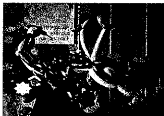
クリスマス会 （バルーンショー）