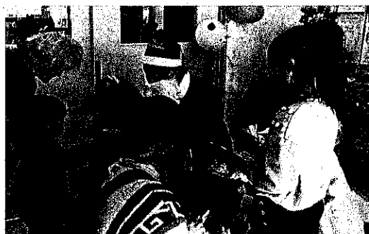
クリスマス会 (プレゼントを用意して、サンタとトナカイの衣装で、渡してくれました)