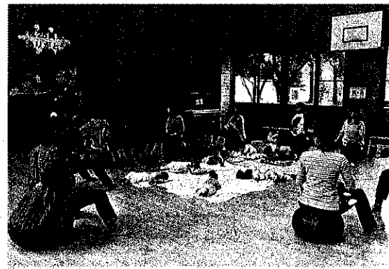
バランスボール (正しい姿勢をチェック中)