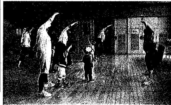
親子リズム (リズムに合わせてがんばるぞ)