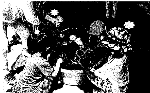
スーパーボールすくい (沢山すくえて楽しいな)