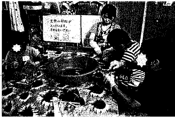
Tシャツ染(輪ゴムでしばって絞り染め)