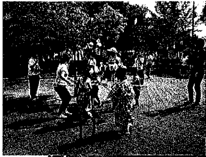
夏祭り ワッショイ ワッショイ