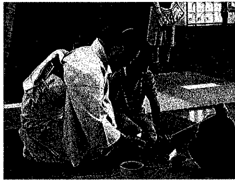
お抹茶体験で お作法を教わ りました