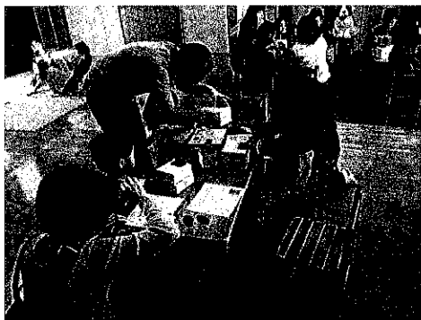
お正月遊び 獅子頭を作ったり、 こま回しや羽根つき で遊んだよ