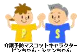
介護予防マスコットキャラクター ピンちゃん・シャンちゃん

今回、この計画の「原案」を作成しましたので、骨子案に関するパブリックコメント（意見募集）を実施します。皆様からいただいたご意見を踏まえ、本年度中に計画を策定し、公表する予定です。