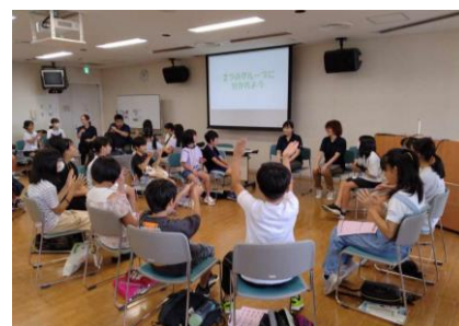
グループ学習で大盛り上がり！

ユーモアたっぷりの講師たちが明るい雰囲気教えてくれるため、子どもたちに大人気の講座となっています。