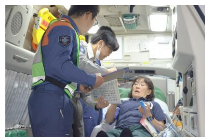
救急車の車内で本格的な演習も行いました。頼もしいですね！

また、救急車の車内を再現した本格的な演習も行い、より実践的な技能の習得を目指しました。