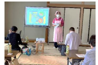
食生活改善推進員による 食育活動の様子