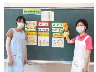
給食時間の リモート指導の様子