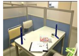
特定保健指導会場の様子