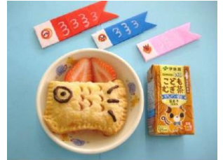
お楽しみおやつの例