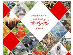
赤城の恵ブランド