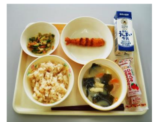
4月の行事食 (入学・進学祝い)