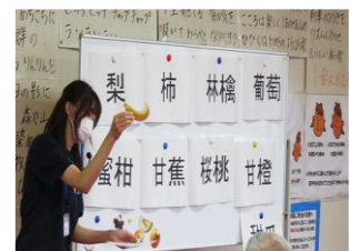
老人福祉センターでの健康教育