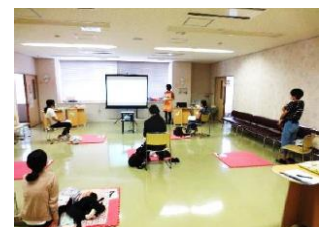
離乳食講習会の様子