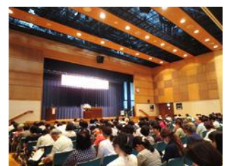
食品安全講習会の様子