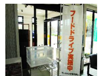
まえばしフードバンク事業の様子