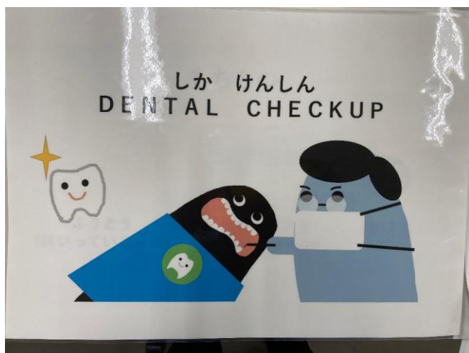
①簡単な英語とイラストを使って歯科健診のPR