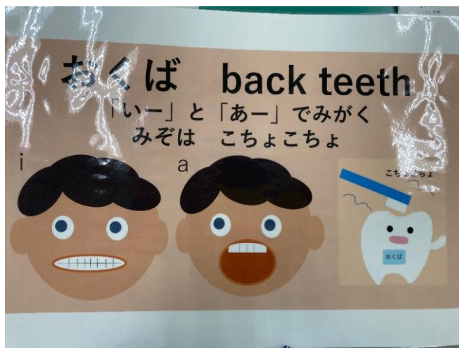
②ブラッシング指導もイラストで