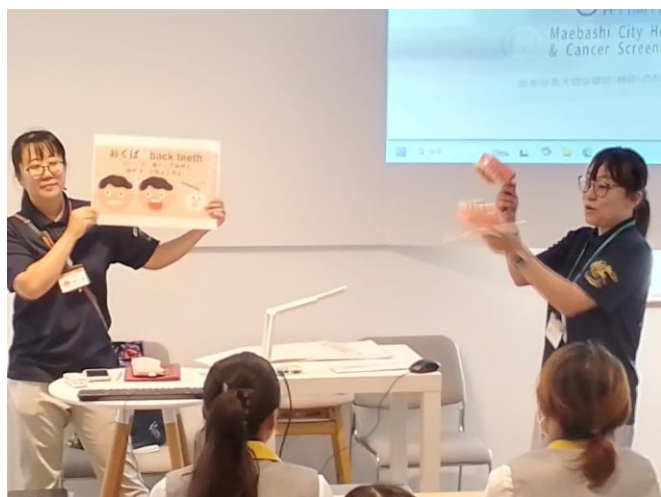
③顎模型とイラストを用いてブラッシング指導