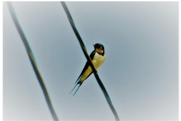
観測地点：下長磯町