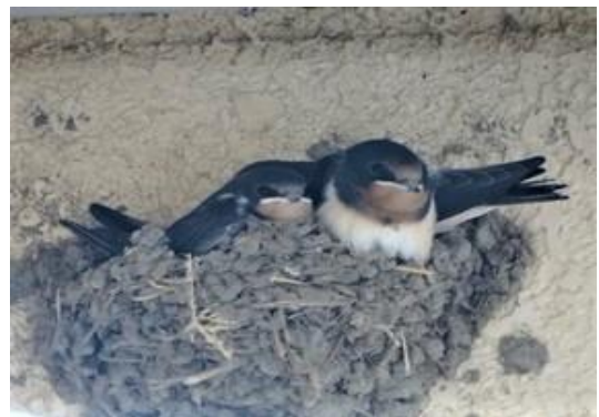
【地点】の 富士見町原之郷