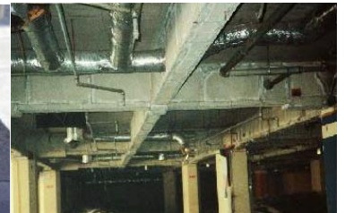
鉄骨を被覆して保護 石綿含有耐火被覆材