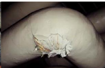
エルボ部に使用 石綿含有保温材