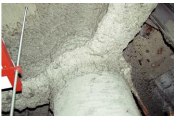
柱や梁に施工 吹付け石綿