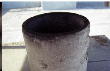
煙突の内側に使用 石綿含有断熱材