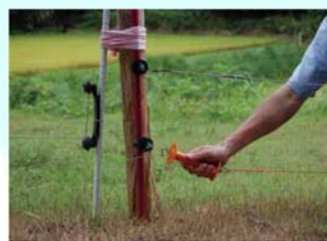
侵入防止柵の設置