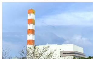
焼却：六供清掃工場