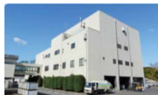
資源化：荻窪清掃工場