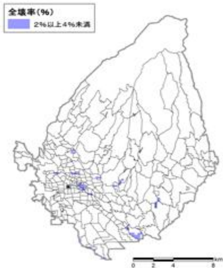
液状化による建物全壊率分布