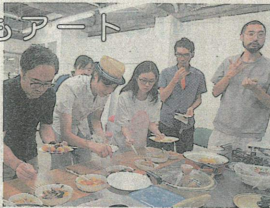
キムさん(右)とともに肉じゃがの食べ比べを楽しむ参加者

の日は、同市の製麺所などを取材した映像を上映したほか、市内の資料館で得た情報から、精米で使われた一升瓶と棒を思わせるオブジェなどを展示した。