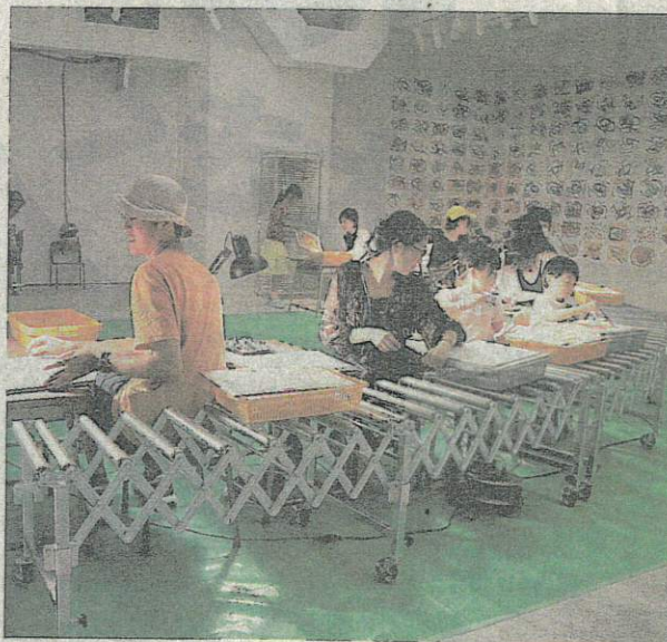
ワークショップで「ベルトコンベアー」を体験する参加者（7月27日）

「前橋を知るテキストにした」という作品も興味深い。赤城山の伝説や市議会議員を題材にするなど、独自の視点で「前橋を描き出している。同館の取り組みを振り返る展示では、収蔵作品や「サポーター」と呼ばれるボランティアスタッフの活動、学芸員とアーティストによる地域住民とのアートプロジェクトなどを紹介。「近い未来、