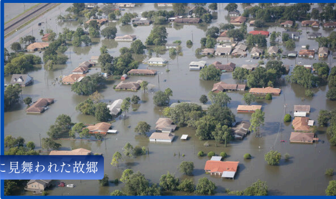
洪水に見舞われた故郷

まず、私の住むテキサス州に最後に大きな影響を与えたハリケーンは「ハリケーン・ベリル」でした。しかし、ハリケーンではあったものの、私がこれまで経験してきた本当に大規模なものに比べると、少し雨が強い程度にしか感じられませんでした。