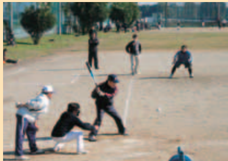
11月 ソフトボール大会