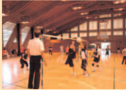
6月 ソフトバレーボール大会