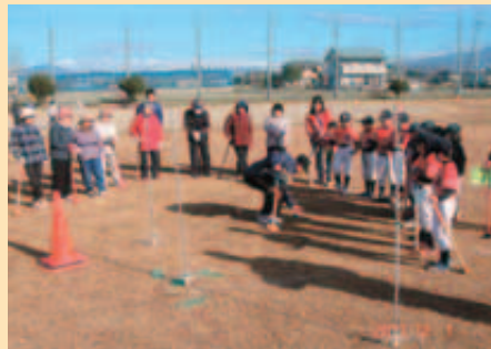
12月 軽スポーツ教室