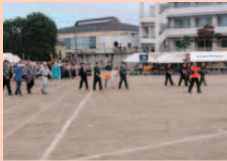
4月 町民スポーツ総合開会式・オープニング大会