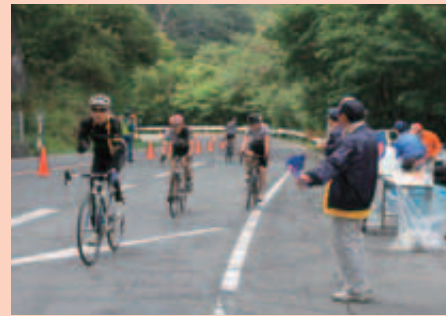
9月 まえばし赤城山ヒルクライム