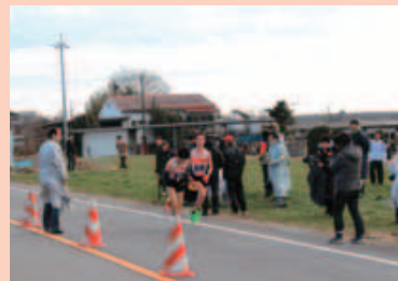
1月 群馬県100km駅伝大会