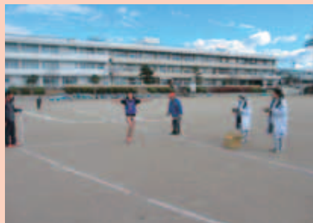
12月 町民マラソン・ファミリーランニング