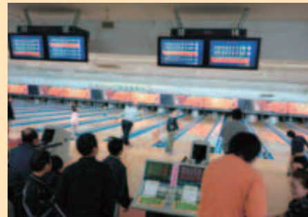
2月 ボウリング大会