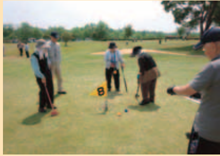
5月 グラウンドゴルフ大会