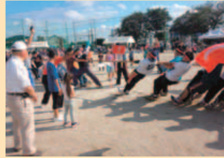
10月 地区市民体育祭