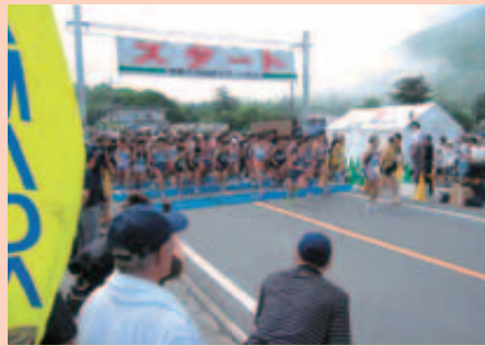
8月 あかぎ大沼・白樺マラソン大会