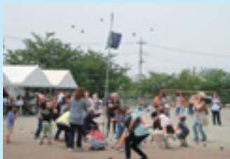
のびゆくこどものつどい（協力）

委員会は、広報部、研修部、調査研究部、指導部に分かれ、委員としての資質の向上に努力しています。