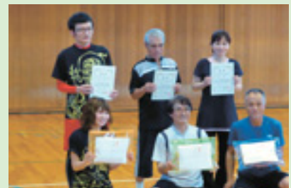
スポレック優勝チーム