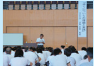
二日目 第一分科会