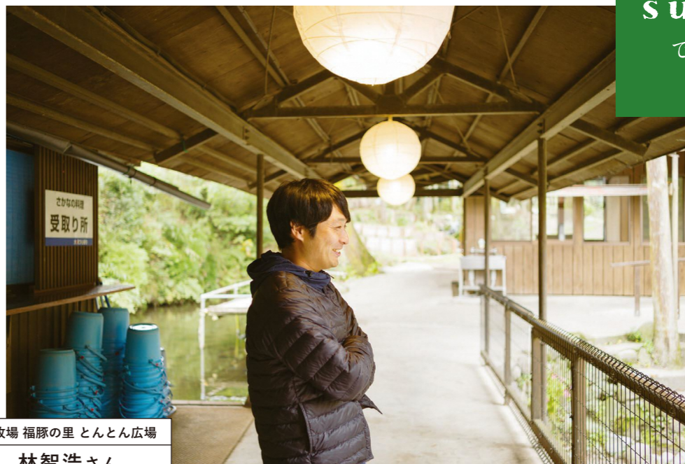
林牧場 福豚の里 とんとん広場