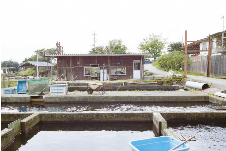
赤城南麓にある、60年の歴史を持つ釣り堀。釣った魚はその場で炭焼きやから揚げにして食べることができる。

群馬県前橋市三夜沢町 534 とんとん広場内 Tel. 027-283-2983 (とんとん広場) maebashi-ngs.com