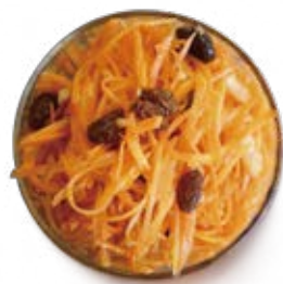
人参とレーズンのサラダ 100g/¥320