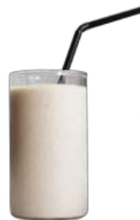
ノンシュガーシェイク チャイティー ¥620