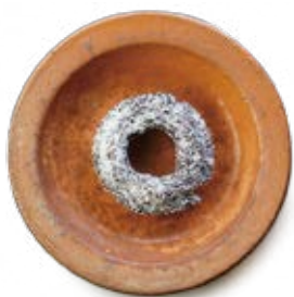
豆腐ドーナツ ココocoa ¥240

「monsoon donuts」 群馬県前橋市住吉町2-1-18 027-226-5241 12:00~18:00 日曜・月曜定休