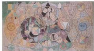
観覧無料 アート前橋 ギャラリー1

アート前橋では、「地域ゆかりの作家の作品を中心とした収集」「美術館の諸活動に関連した作品の収集」「アートの想像力によって地域に貢献できる作品の収集」という3つの方針に基づき、作品の収集活動を行ってきました。本展では、近年の収蔵作品の中から 未公開の作品 を中心に、絵画、彫刻、写真、映像などの作品を、I期（2020年度収蔵）、II期（2019年度収蔵）の2部構成で展示します。また、作家の活動や作品制作の背景、展覧会、地域アートプロジェクト、ラーニング・プログラムなどの諸活動との関連、収蔵後の修復作業などについてもあわせて紹介します。本展を通して、鑑賞者の皆さまに収蔵作品の魅力について触れていただくとともに、アート前橋の活動について理解を深めていただくことができれば幸いです。