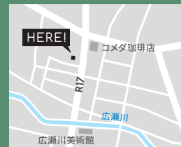
前橋市住吉町1-13-24 住吉ビル2F