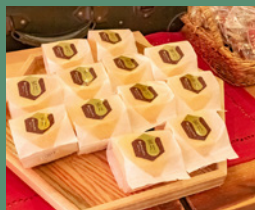
奥利根産純粋はちみつ「黄金の掬」入り 焼きまんじゅうマフィン