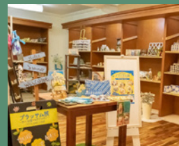
店内にはイベントスペースがあり、県内の 作家さんの作品が展示販売されている。