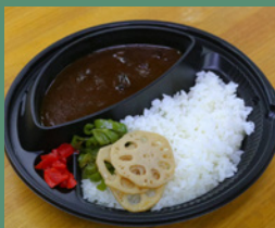
調理に数日かけているブラックカレーは味わいも深い。