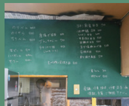
和・洋・中と色々なジャンルのお弁当が充実している。