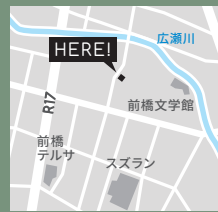
前橋市千代田町3丁目9-1