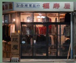
福寿屋金物店の看板は縁起物としてそのままに。