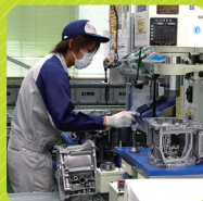
製造技能職のスタッフ

富士重工業(SUBARU)グループの一員として、企業スケールを拡大し続けるトランスミッション専門メーカーです。世界に羽ばたく製品づくりに共に挑みませんか。