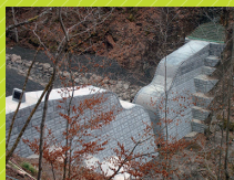
トキワコンクリート工業の製品を用いた砂防ダム