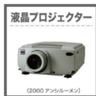
液晶プロジェクター プロジェクター (2000ANSI) (100,000円) ※上記以上の性能も用意可能です。