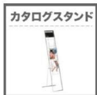
カタログスタンド カタログスタンド (自立式) (8,000円) w450×d390×h1243 ※自立式：A4サイズのラック

* 各イベントへの御申込後に、マイナビ進学イベント事務局より出展者様専用管理画面へのURLをご案内させていただきます。