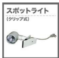
スポットライト (クリップ式) スポットライト (クリップ式) (5,000円)