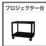
プロジェクター台 プロジェクター台 (6,000円) 幅687mm×奥行460mm×高さ860mm