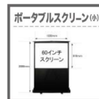
ポータブルスクリーン(小) ポータブルスクリーン (小) (10,000円) ロールアップ式：スクリーン部 W1200mm×H900mm