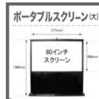
ポータブルスクリーン(大) ポータブルスクリーン (大) (15,000円) ロールアップ式：スクリーン部 W1800mm×H1000mm