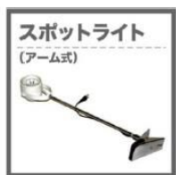
スポットライト (アーム式) スポットライト (アーム式) (5,000円)