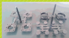
前橋成形工業が製作した金型によって成型した製品

製造業のものづくりの楽しさや、自分が関わったものが店頭に並んでた時の喜びを味わってみませんか？ うまくいかないこともありますが、日々研鑽に努めて一緒に頑張りましょう。