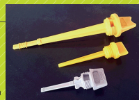
射出成形で製作した製品

製造業のものづくりの楽しさや、自分が関わったものが店頭に並んでた時の喜びを味わってみませんか？ うまくいかないこともありますが、日々研鑽に努めて一緒に頑張りましょう。