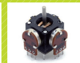
ジョイスティック