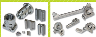
浦和製作所が加工した、自動車向けステアリング部品、工作機械向け及び半導体製造装置向けの異形状部品

私達は日々新しい加工の難問に挑戦しながら、URAWAの技術力を更にのばして行く為、育成にも全力で取り組んでいます。