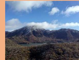
⑥ 蛭子山から大沼方面の眺望