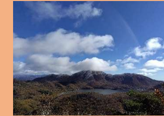
⑦ 楢柄山から大沼方面の眺望