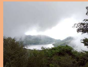
⑧ 出張山から大沼方面の眺望