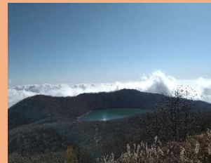
⑤ 地藏岳から小沼方面の眺望