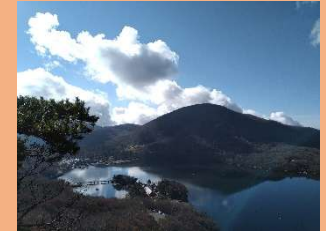
① 黒檜山から大沼方面の眺望

※写真番号と裏面の位置図の番号が一致していますので、ご参照ください。(写真の視点場は前橋市内です。)