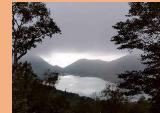
⑩ 陣笠山から大沼方面の眺望