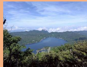
② 駒ヶ岳から大沼方面の眺望