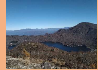
④ 地藏岳から大沼方面の眺望