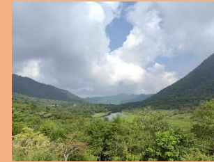
③ 鳥居峠から覚満淵方面の眺望