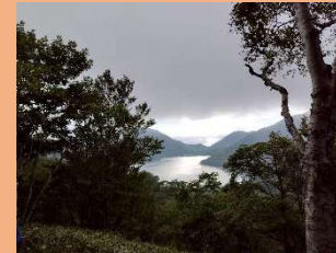
⑨ 薬師岳から大沼方面の眺望