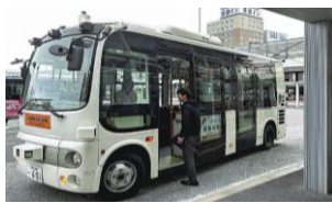
自動運転実証実験