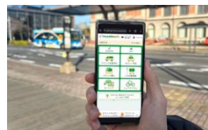
GunMaas INNOVATE YOUR TRIPS

今後、これらの課題に個々に対処すると、統一感が失われ、魅力に欠ける街並みが形成される可能性があるため、未来を指向するデザインコンセプトが必要であり、群馬県ではメインストリートにおいて、 空間デザインの策定 を進めています。