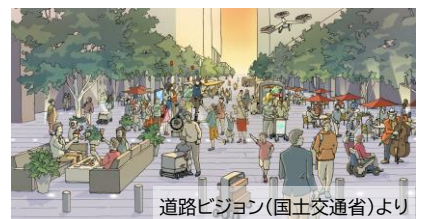
道路ビジョン(国土交通省)より

この取組から、居心地がよく歩きたくなるまちを目指すことをウォカブルなまちづくりといいます。