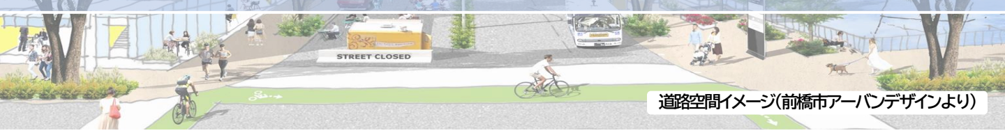
道路空間イメージ(前橋市アーバンデザインより)