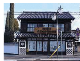
老舗三俣せんべい本店 (前橋市景観資産)