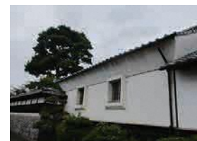
農家表門等・牛込邸 (前橋市景観資産)