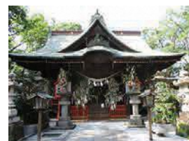
総社神社 (県指定重要文化財)