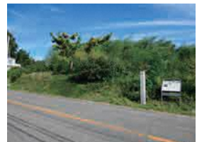
オブ塚古墳 (市指定史跡)