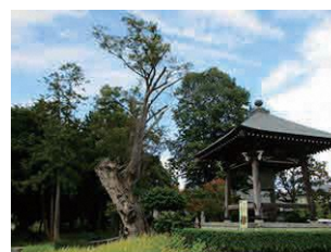
極楽寺の大けやき