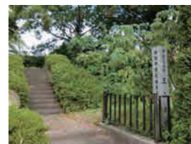
王山古墳 (市指定史跡)