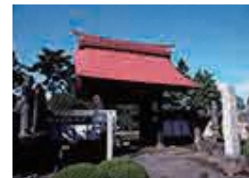
大徳寺総門 (市指定重要文化財)