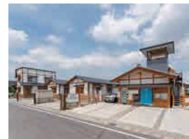
蒼海宿 (前橋市景観資産)