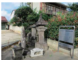
亀里町阿内宿の石幢 (市指定重要文化財)