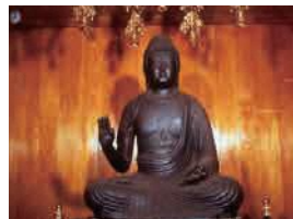
鉄造阿彌陀如来坐像 (善勝寺・国指定重要文化財)