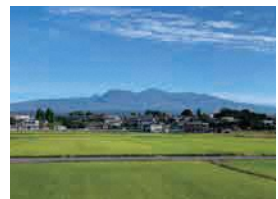
端気町から眺望する赤城山 (前橋市景観資産)