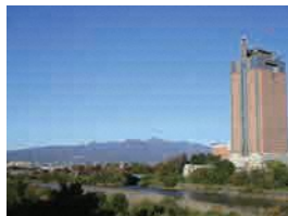
群馬大橋付近から望む赤城山 (前橋市景観資産)