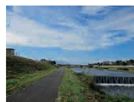
桃ノ木川 サイクリングロード