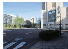
新前橋駅前の街並み