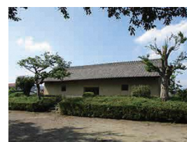
上泉郷蔵 (県指定史跡)