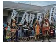
総社秋元公歴史まつり