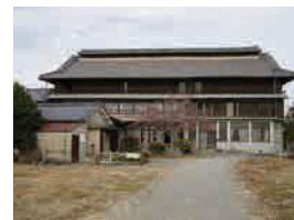
塩原家住宅 (国指定重要文化財)