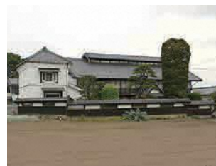
養蚕農家・小池邸 （前橋市景観資産）