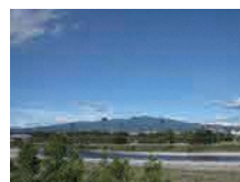
大渡橋から眺望する赤城山 (前橋市景観資産)