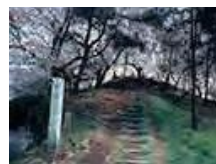
総社古墳群 (国指定史跡)