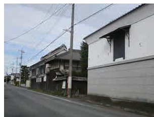
旧街道沿いの街並み