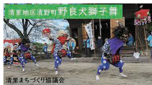
野良犬獅子舞（清野町八幡宮） （市指定重要無形民俗文化財）