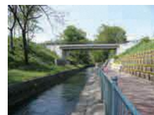
天狗岩用水 (世界かんがい施設遺産)