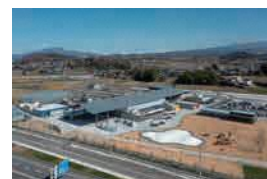
道の駅まえばし赤城