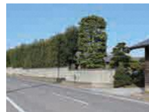
養蚕住宅群とかしぐね (前橋市景観資産)