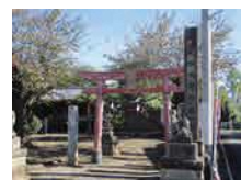
一本木稻荷神社 (前橋市景観資産)