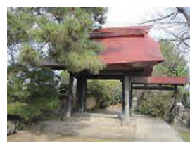
養林寺の山門 (前橋市景観資産)