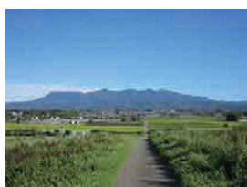
深津稻荷山から望む赤城山 (前橋市景観資産)