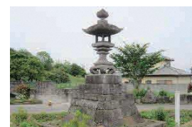
馬場の大燈籠 (市指定史跡)