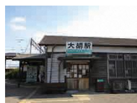
上毛電気鉄道大胡駅駅舎 (国登録有形文化財)