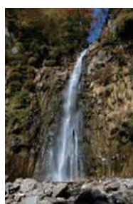
滝沢の不動滝 (県指定名勝)