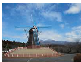
道の駅 ぐりんふらわー牧場・大胡