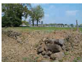
大胡城跡 (県指定史跡)