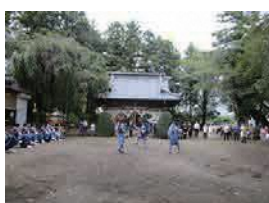
月田近戸神社の獅子舞 (県指定重要民俗文化財)