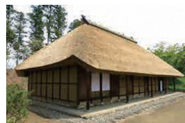
阿久沢家住宅 (国指定重要文化財)