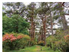
三夜沢赤城神社参道松並木 (前橋市景観資産)