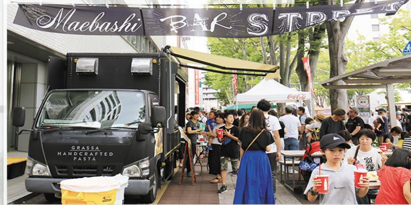
前橋バルストリート

■30歳代から50歳代の子育て世代の大人をターゲットに、「道路」という公共空間で飲食を楽しむ北関東最大級の屋外型フードフェス。