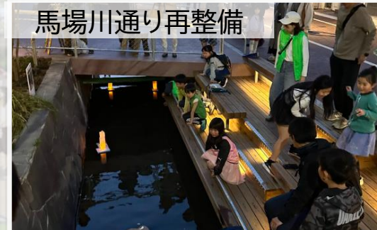
馬場川通り再整備

■前橋市中心街を流れる馬場川沿いの市道・遊歩道を民間企業が事業主体となって、リニューアルした。