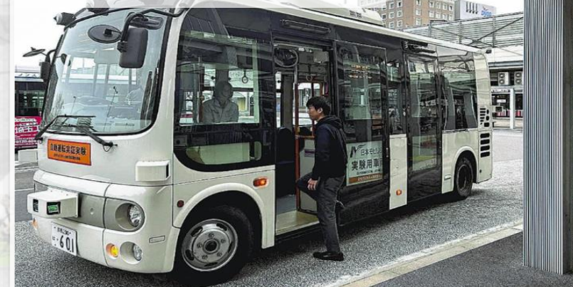
自動運転実証実験

■スマートフォンひとつで、目的地までのルート検索から、予約、決済までの手続きを一括で可能とする交通系WEBアプリケーション。