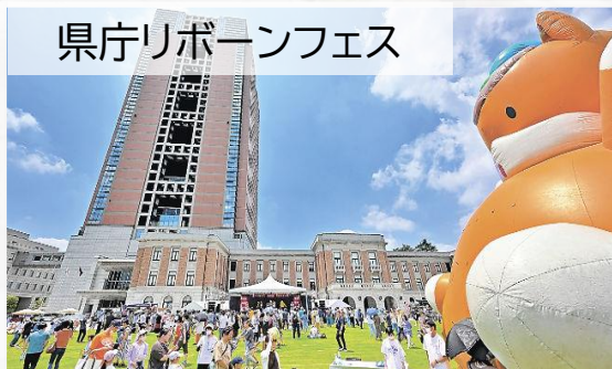
県庁リボーンフェス

■群馬県庁舎リノベーションのオープニングイベント。地元企業によるキッチンカーが出店されるなど、多くの県民で賑わった。