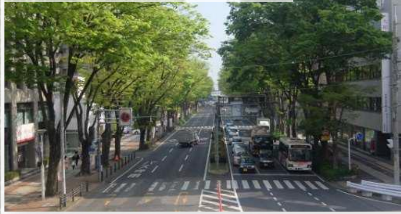
シンボルロード けやき並木通り