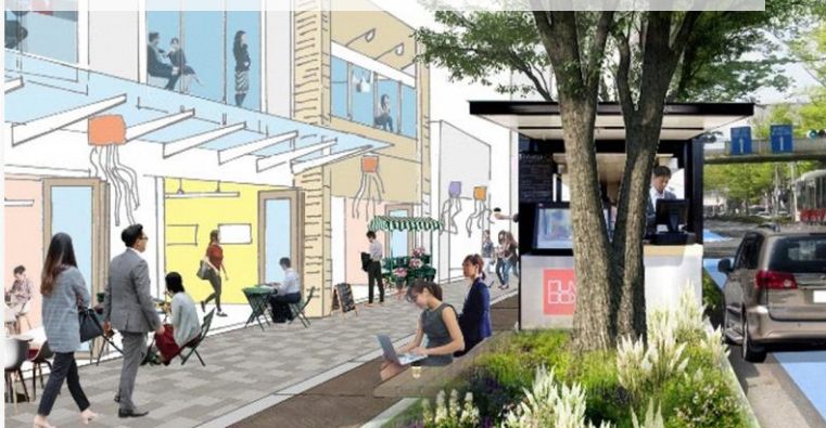
けやき並木通り(前橋アーバンデザイン※)

■けやき並木通りの将来像。県都としての高質な景観を維持し、通りの賑わいを楽しみながら歩ける店舗や路上空間を創出する。 ※前橋アーバンデザインとは 前橋市における民間主体のまちづくりを推進するための指針。