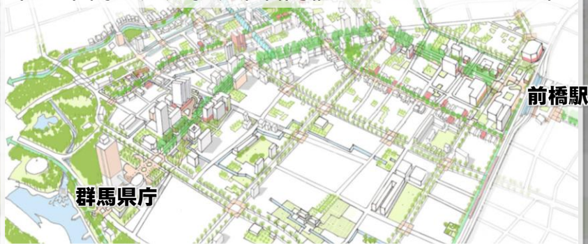
中心市街地周辺拡大図(前橋アーバンデザイン※)