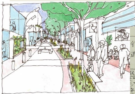
銀座通りにおける官民の役割整理