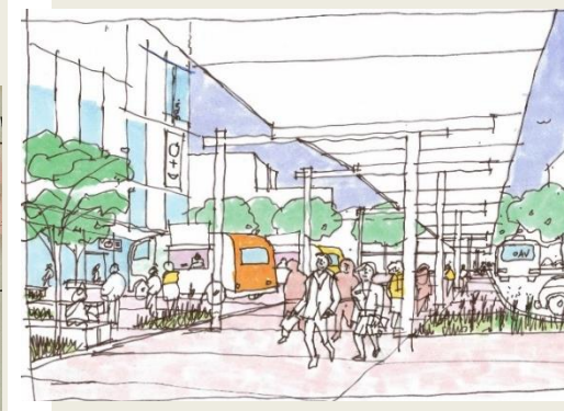
JR前橋駅前における官民の役割整理