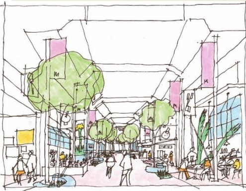
中央通りにおける官民の役割整理