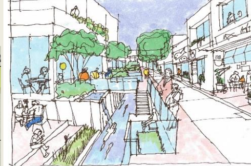
馬場川通りにおける官民の役割整理