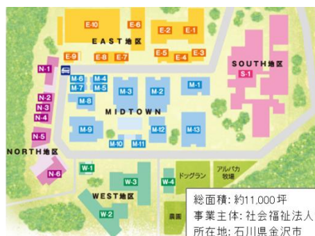
総面積：約11,000坪 事業主体：社会福祉法人佛子園 所在地：石川県金沢市 (香林坊まで車で約12分)