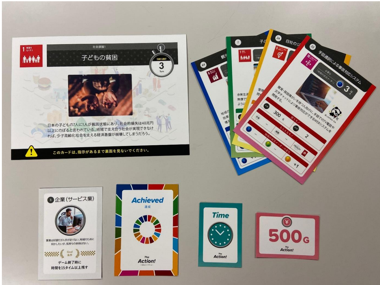
SDGsカードゲームイメージ