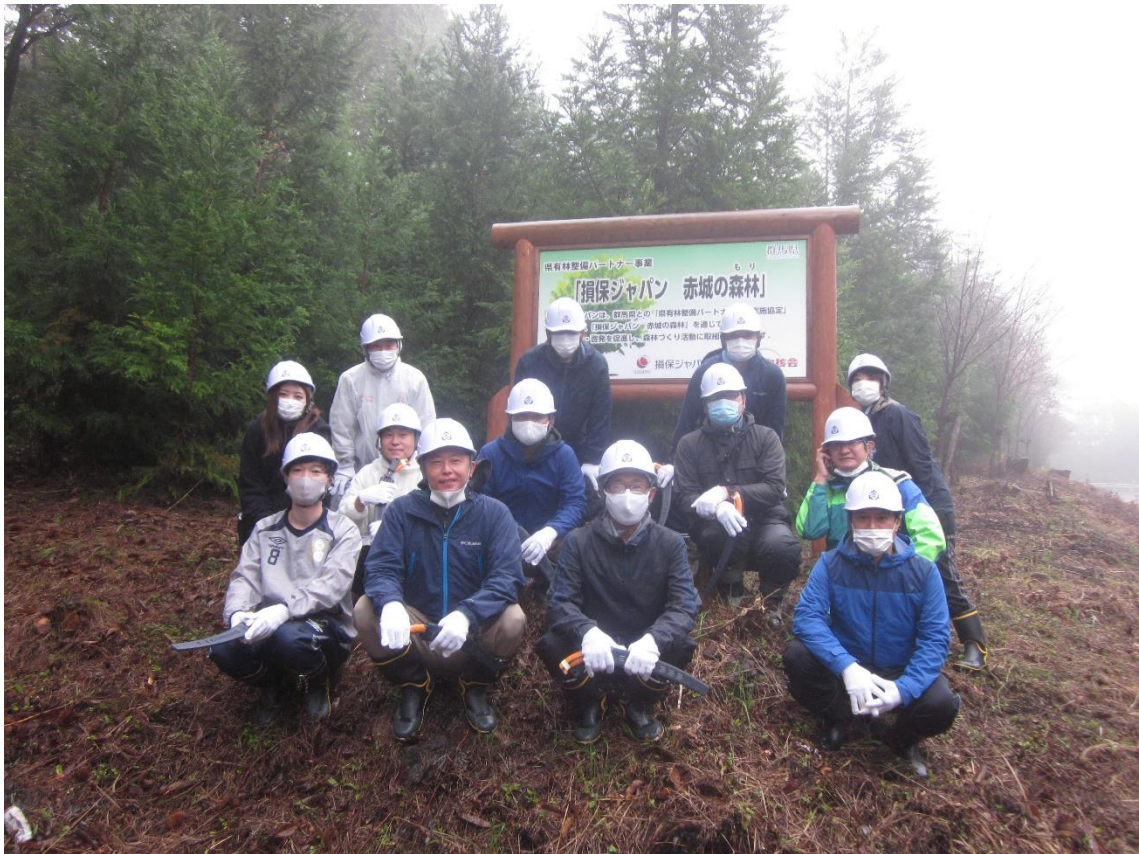
赤城の森林の活動の様子