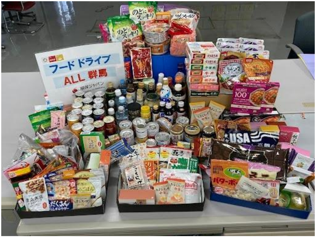
フードバンク寄付