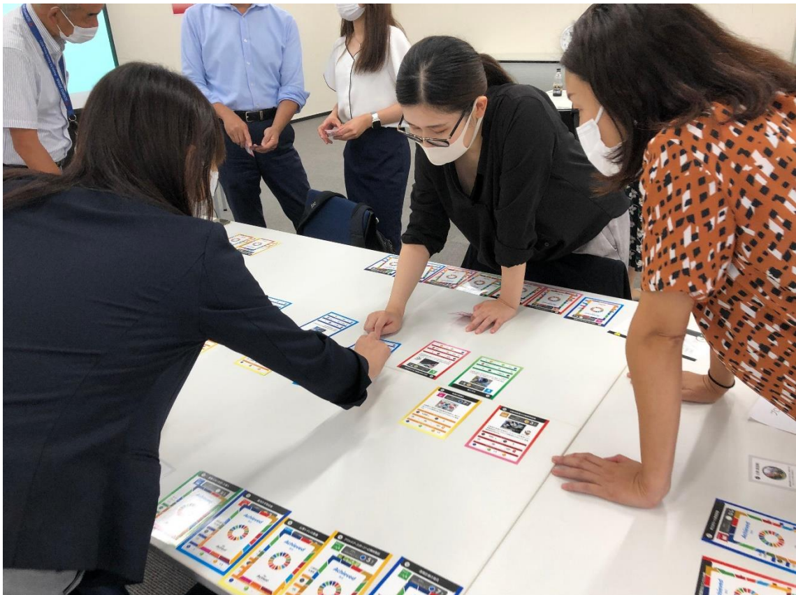
SDGsカードゲームの様子