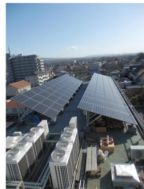
太陽光発電パネル