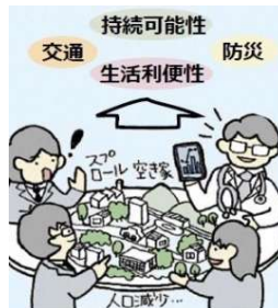
対話型市民説明会(オープンハウス)過去の開催状況