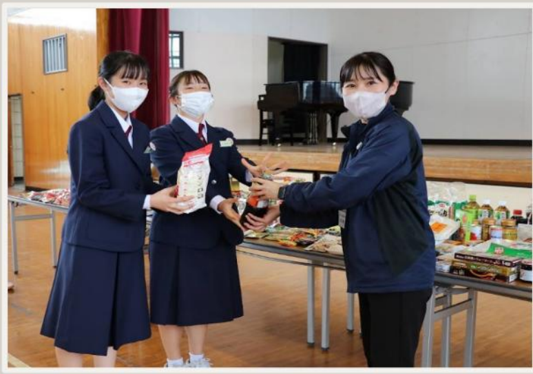
食品の寄付(寄贈式)