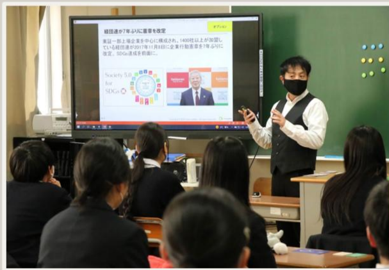
2030 SDGs カードゲーム