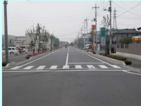
基幹事業(土地区画整理事業) ・六供土地区画整理事業