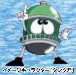
イメージキャラクター「タンク君」