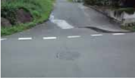
▲道路上の漏水状況